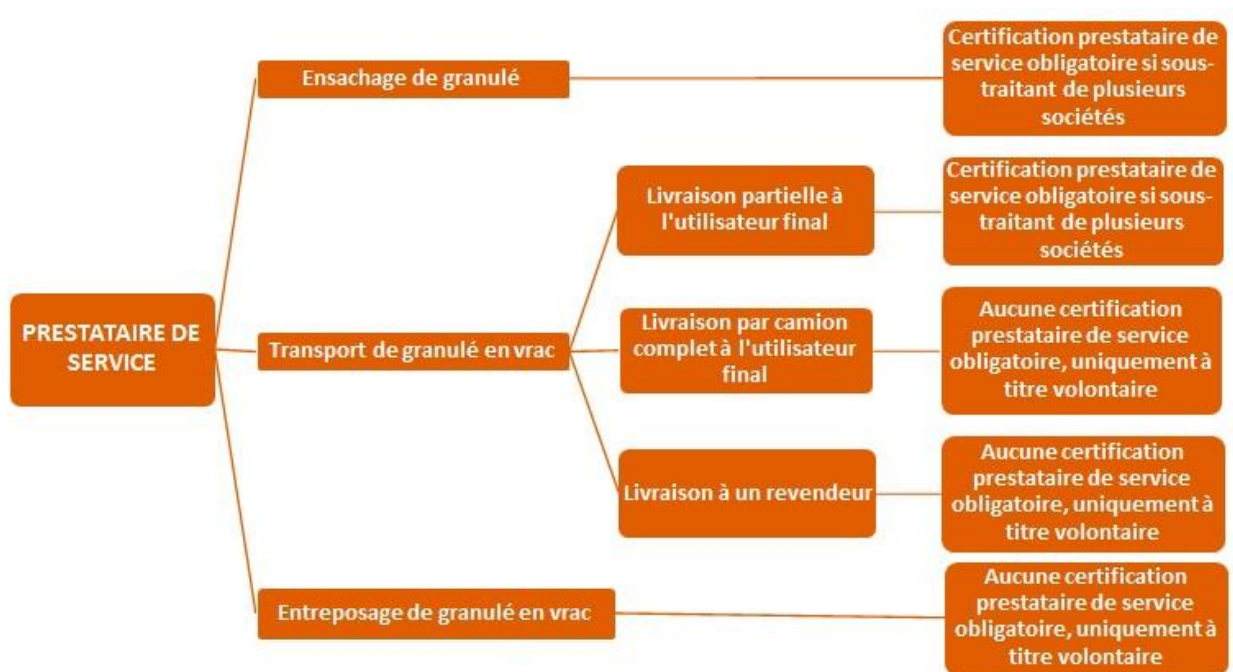
Tableau 3: Vue des obligations de certification d'un prestataire de services en fonction de ses différentes activités.

Les conditions selon lesquelles un prestataire de services doit être certifié et par conséquent payer une redevance sont définies dans le tableau 3.