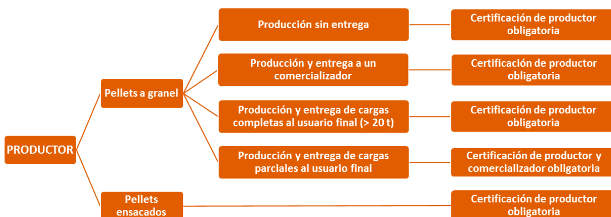
Figura 1: Esquema de certificaciones necesarias para productores con diferentes actividades comerciales

Las condiciones bajo las que un productor debe certificarse, y por tanto abonar las tarifas correspondientes, se definen en el siguiente gráfico.