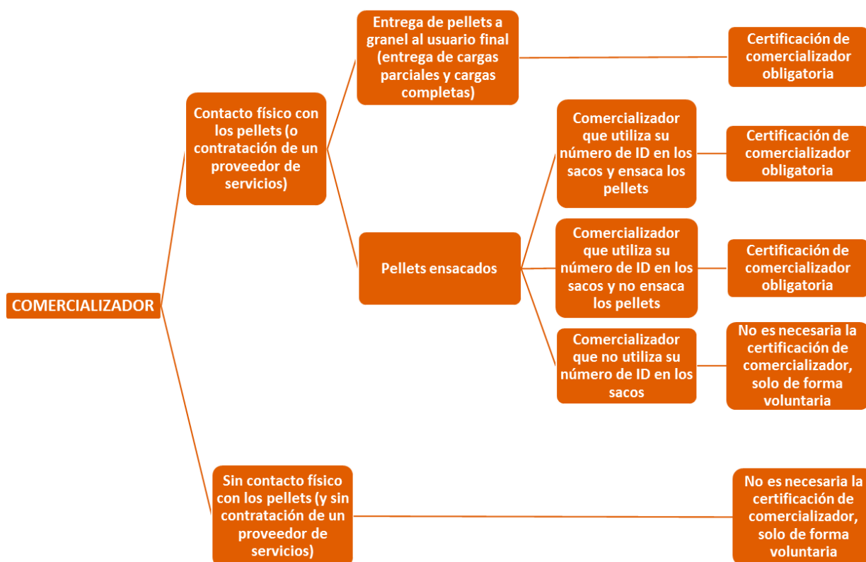
Figura 2: Esquema de certificaciones necesarias para comercializadores con diferentes actividades comerciales

Las condiciones bajo las que un comercializador debe certificarse, y por tanto abonar las tarifas correspondientes, se definen en el siguiente gráfico.