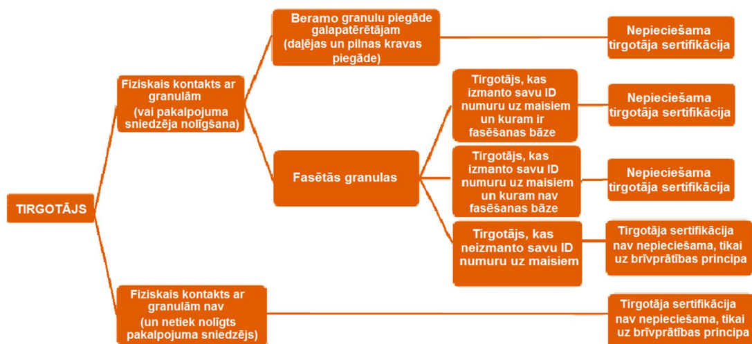
2. Attēls: Nepieciešamās sertifikācijas apskats tirgotājiem ar atšķirīgu uzņēmējdarbību

Nosacījumi, saskaņā ar kuriem tirgotājs tiek sertificēts, un, tāpat, saskaņā ar kuriem viņam ir jāmaksā nodevas, parādīti zemāk sniegtajā grafikā.